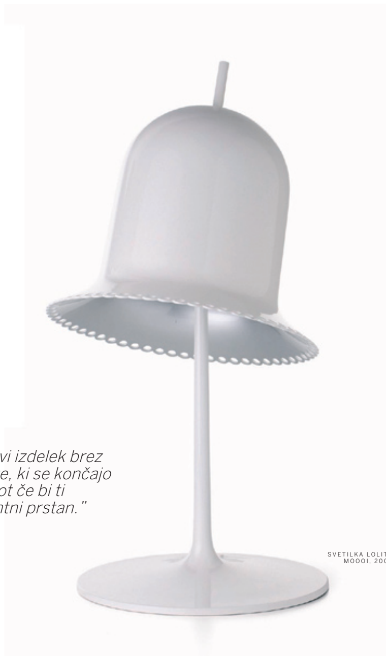
SVETILKA LOLITA MOOOI. 2008

S Scarlet in Clarisso površne opazovalce mečemo na finto, saj smo prav namenoma postavile podobo hiše, ki ne more nikogar prevarati, da gre za resnično hišo, saj je zakrita za masko ikone, znaka, ki govori kvečjemu o tem, da emancipacija še zdaleč ni končana. Vsaj v oblikovalski