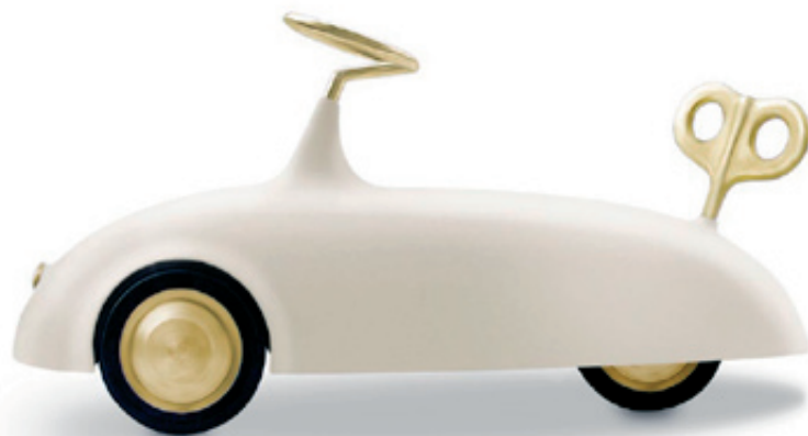
OTROŠKI AVTOMOBILČEK KONSTANTIN BETA

”Če je takšne barve punčka iz celuloida, je to eno, če pa je takšne barve avto, klasični falični simbol, je to nekaj povsem drugega. Jaz pač rada in namenoma problematične vsebine zavijam v klišejske, lepe, arhetipske podobe: v podobe, ki veljajo za izrazito feminilne, frfotave, narobe razumljene“