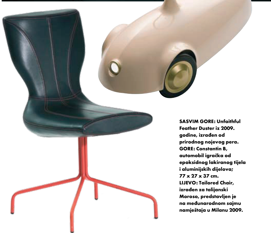
SASVIM GORE: Unfaithful Feather Duster iz 2009. godine, izrađen od prirodnog nojevog pera. GORE: Constantin B, automobil igračka od epoksidnog lakiranog tijela i aluminijskih dijelova; 77 x 27 x 37 cm. LIJEVO: Tailored Chair, izrađen za talijanski Moroso, predstavljen je na međunarodnom sajmu namještaja u Milanu 2009.

razvio upravo zahvaljujući tim sajmovima, jer se tamo najučinkovitije izgradi vlastiti identitet na međunarodnoj sceni, kao i odnosi s proizvođačima i medijima. Kasnije održavanje i učvršćivanje tih odnosa jednako je kao i s bilo kojim drugim odnosima: morate ulagati u njih, biti pasionirani te na kraju - morate biti na pravome mjestu u pravo vrijeme.