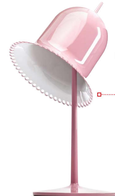
Пластиковая лампа Lolita с трогательными рюшами на абажуре – разработка Ники Зупанк для компании Moooi.

проектов. Объединить все характеристики в каждой новой разработке не так-то просто. Но если это удается, то вокруг проекта образуется особый ореол, который позволяет ему выделиться из массы. И в такой ситуации, быть женщиной в этой, можно сказать, мужской профессии, не минус, а дополнительный плюс.